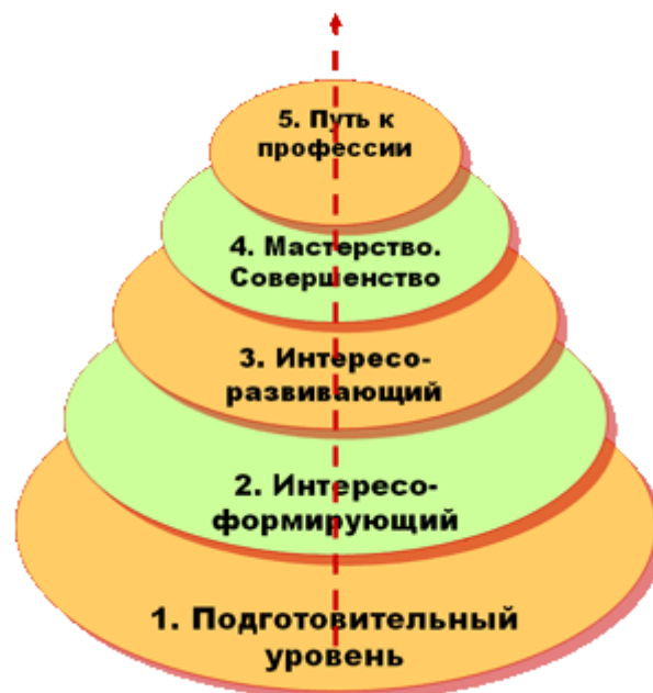
Схема реализации комплексных образовательных программ детских объединений ДТДиМ

Учреждение создает равные «стартовые» возможности каждому ребёнку, чутко реагируя на быстро меняющиеся потребности детей и их родителей, оказывает помощь и поддержку одарённым и талантливым учащимся, поднимая их на качественно новый уровень индивидуального развития.