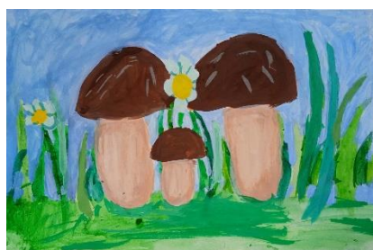
Денисова Оливия 7 лет

Ребята, посмотрите, не зря нам встретились мухоморы и белочки прислали настоящую подсказку! Я нашла белый гриб: какой красивый, крепенький, на толстой ножке!