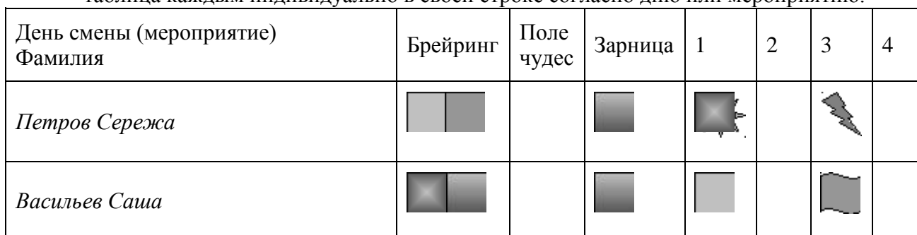
Рис. 9. Экран-таблица.

• Экран-таблица. Соответственно он составляется в форме таблицы (рис. 9), где в первой строке либо мероприятия (отрядные или дружинные), либо дни смены (на усмотрение ваших детей и вас), а в первом столбце указываются имена детей. Заполняется таблица каждым индивидуально в своей строке согласно дню или мероприятию.