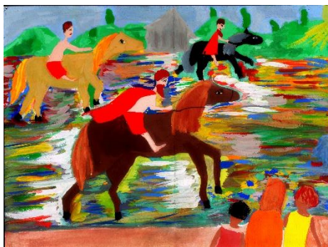
Дель Ариадна 10 лет

Прислушайтесь: издали доносится шум приближающихся лошадей и лай собак. Наверно это король со своей свитой приближенных герцогов, графов и князей направляется на охоту.