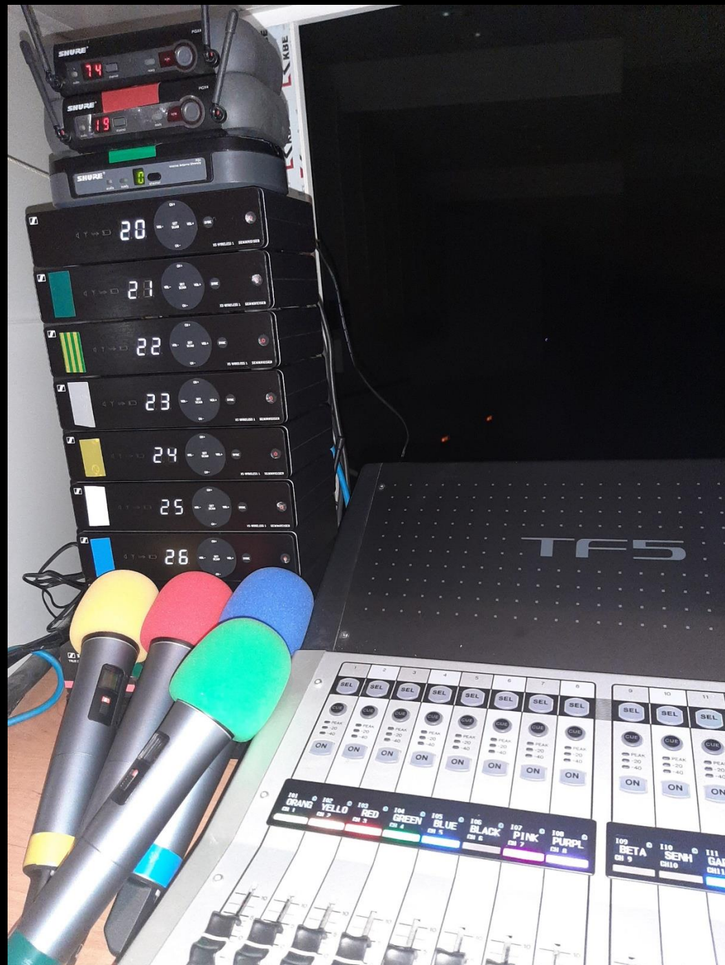
Обновление микрофонного парка