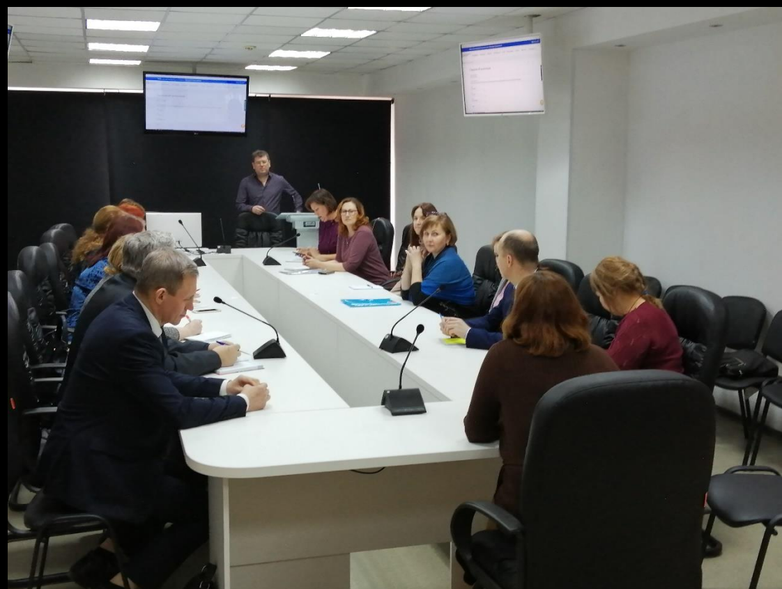
Конференц - зал