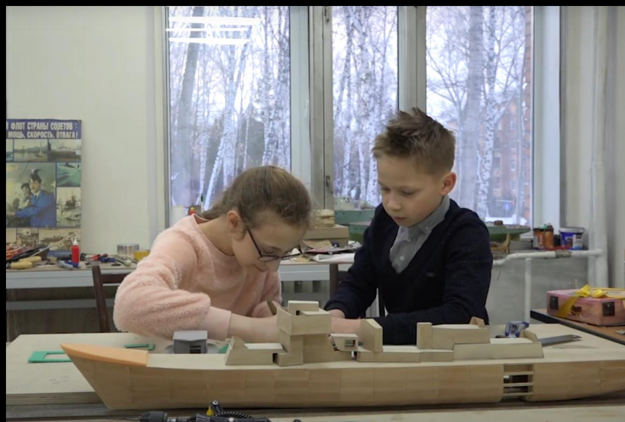
Кабинет для судомоделирования