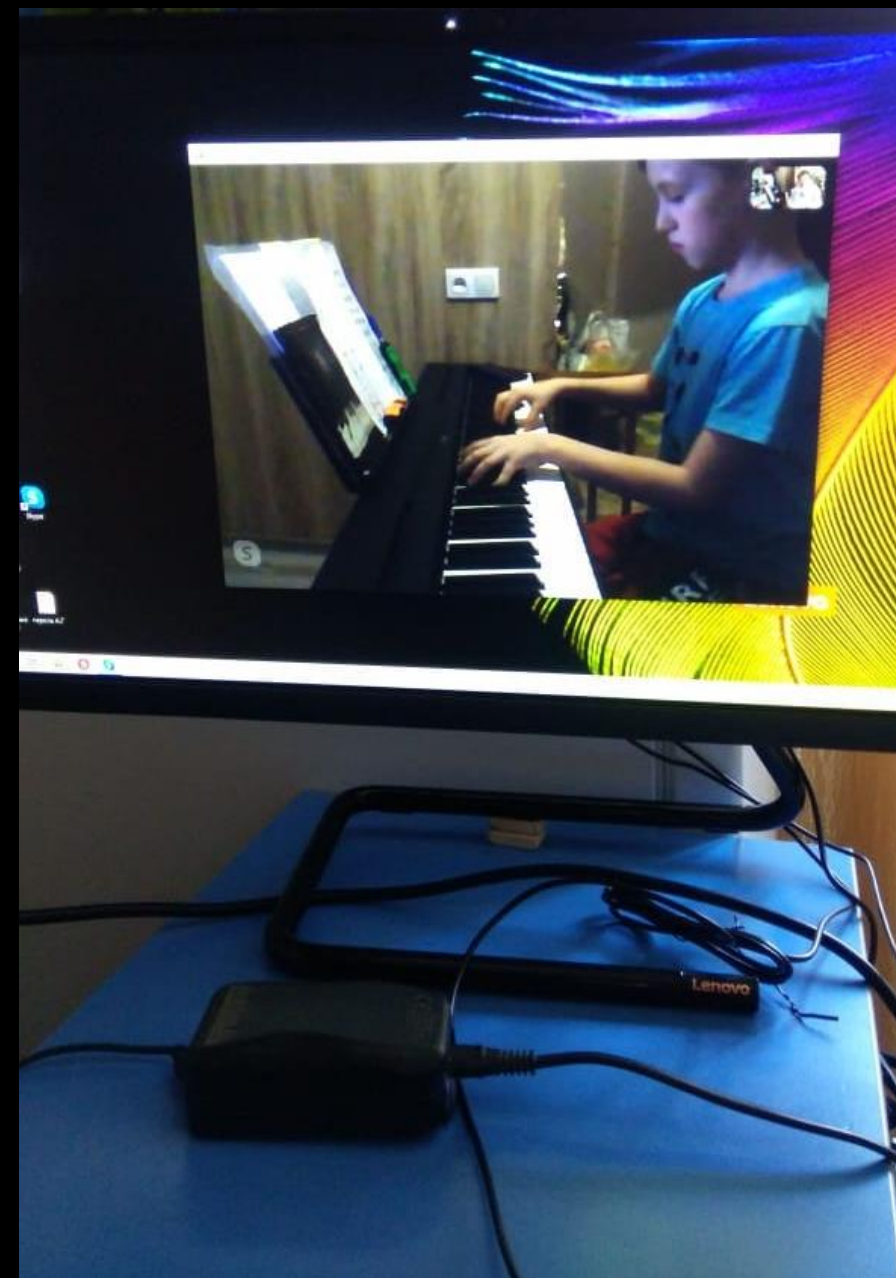
Оборудование и материалы для проведения занятий с детьми с ОВЗ, организации технического творчества