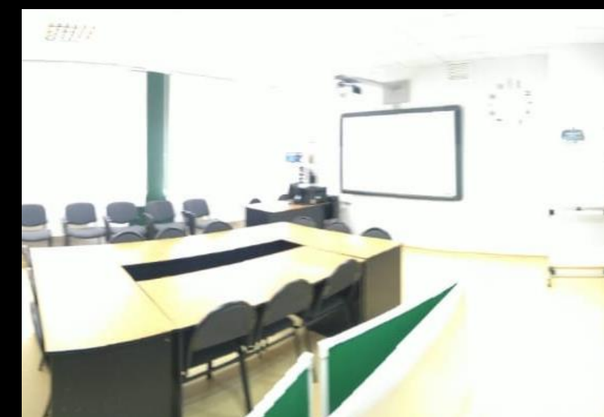
Кабинет для математического кружка